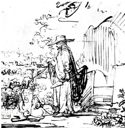
Ik ga op naar mijn Vader en uw Vader, naar mijn God en uw God Johannes 20 Rembrandt van Rijn

1 De mens, Adam, had gemeenschap met Eva, zijn vrouw, en zij werd zwanger en bracht Kain ter wereld. 'Met de hulp van de HEER,' zei ze, 'heb ik het leven geschonken aan een man!' 2 Later bracht ze zijn broer ter wereld, Abel. Abel werd herder, Kain werd landbouwer. 3 Op een keer bracht Kain de HEER een offer van wat hij had geoogst. 4 Ook Abel bracht een offer; van de eerstgeboren dieren van zijn kudde koos hij de mooiste uit. De HEER merkte Abel en zijn offer op, 5 maar voor Kain en zijn offer had hij geen oog. Dat maakte Kain woedend, zijn blik werd donker. 6 De HEER vroeg hem: 'Waarom ben je zo kwaad, waarom kijk je zo donker?' 7 Handel je goed, dan kun je toch iedereen recht in de ogen kijken? Handel je slecht, dan ligt de zonde op de loer, begerig om jou in haar greep te krijgen; maar jij moet sterker zijn dan zij.' 8 Kain zei tegen zijn broer Abel: 'Laten we het veld in gaan.' Toen ze daar waren, viel hij zijn broer aan en sloeg hem dood. 9 Toen vroeg de HEER: 'Waar is Abel, je broer?' 'Dat weet ik niet,' antwoordde Kain. 'Moet ik soms waken over mijn broer?' 10 'Wat heb je gedaan?' zei de HEER. 'Hoor toch hoe het bloed van je broer uit de aarde naar mij schreeuwt.'