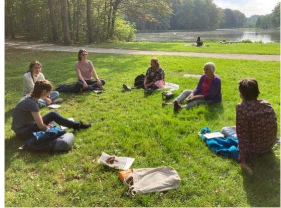
Een rustmoment tijdens de zonnige herfstwandeling in september

Na een leuke verwonderwandeling aan het begin van de herfst op 19 september plannen we de volgende verwonderwandeling: editie winter op zondag 19 december van 14 tot 16 uur.